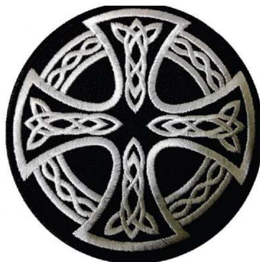
Рисунок 2. Кельтский крест. Символ многих расистских организаций